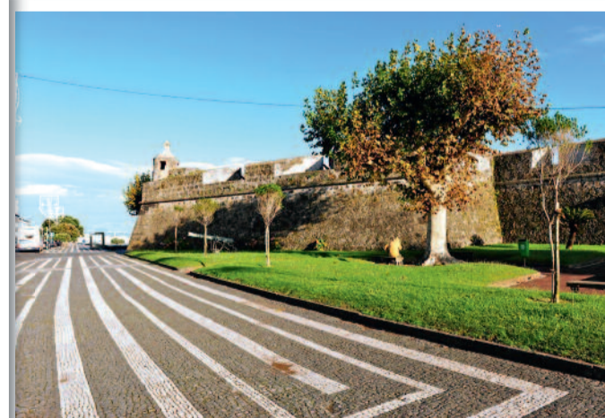
Het massieve Fort van Sao Brás in Ponta Delgada (São Miguel). De straten errond zijn geplaveid met vulkaansteentjes in zwart-witmotieven.

straten, telkens in zwart-witpatroon. Het maakt dat de steden er heel verzorgd en rijk uitzien. Ook veel kerkfaçades zijn ingelegd met zwarte en witte natuurstenen. Maar nóg meer barokke kerkes zijn volgens Portugese traditie geschilderd in snoepkleuren, van lavendelblauw tot citroengeel, steenrood en appelblauw-zeegroen. Van de negen kloosters die Angra telt, krijgt São Francisco de meeste bezoekers: hier bevindt zich het graf van Paulo da Gama, de broer van de beroemde Portugese ontdekkingsreiziger Vasco da Gama. In São Sebastião, de voormalige hoofdstad, verdreven de eilanders de Spanjaarden 500 jaar geleden met behulp van hun stieren. Anno 2011 verglijdt het leven hier nog in een pastoraal ritme. In Porto Martins, waar met lavastenen afgeboorde wijngaarden afgewisseld worden met bananenplantages, verkiest een enkele boer nog zijn ezeltje boven de heilige koe.