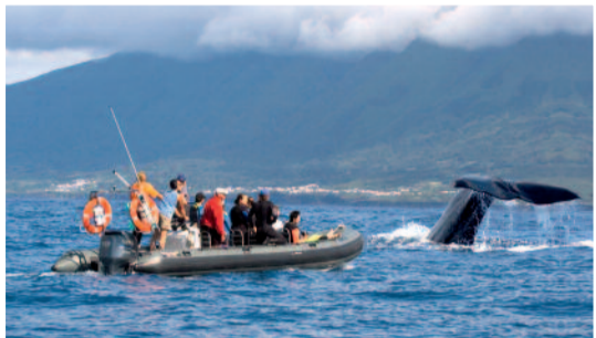
Walvispotters op 'whale watching tour'. Faial was vroeger een centrum van de bloederige jacht op de kolossen.

Praia da Vitória, aan de westkust, is een van de grootste baaien van de Azoren. De eerste week van augustus spelen hier overal bandjes in restaurants en cafés. Zo ook in visrestaurant O Pescador, waar je zeker de Portugese klassieker cataplana moet proberen. Drink er een wit verdelho-wijn bij.