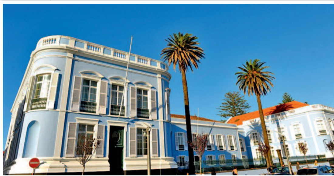
Het babyblauwe Palácio da Conceição in Ponta Delgada, de hoofdstad van het grootste eiland São Miguel.