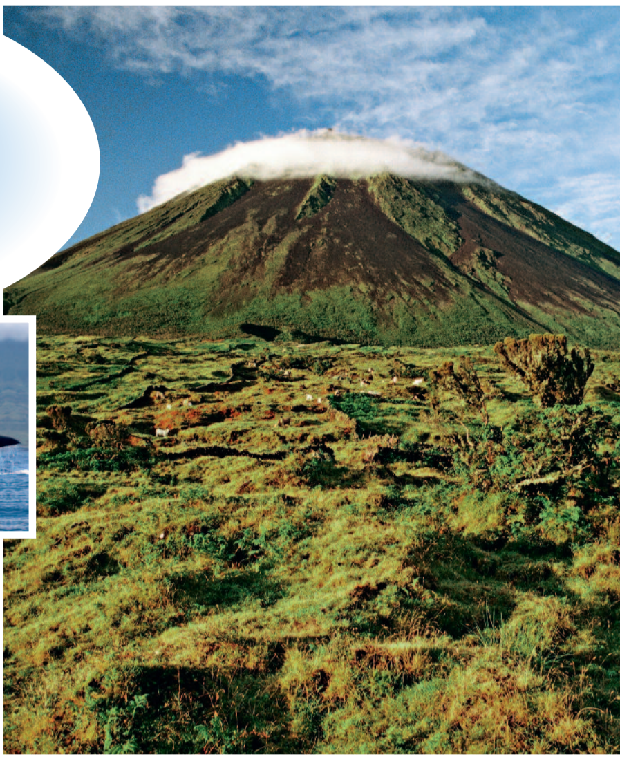
De vulkaan van het eiland Pico, vlak bij Faial, is met zijn 2.351 meter de hoogste berg van Portugal.

Verder langs de noordkust kom je door het dorpje Cedros, waar een kaasfabriek gevestigd is. De roodgetinte kaas van Faial wordt