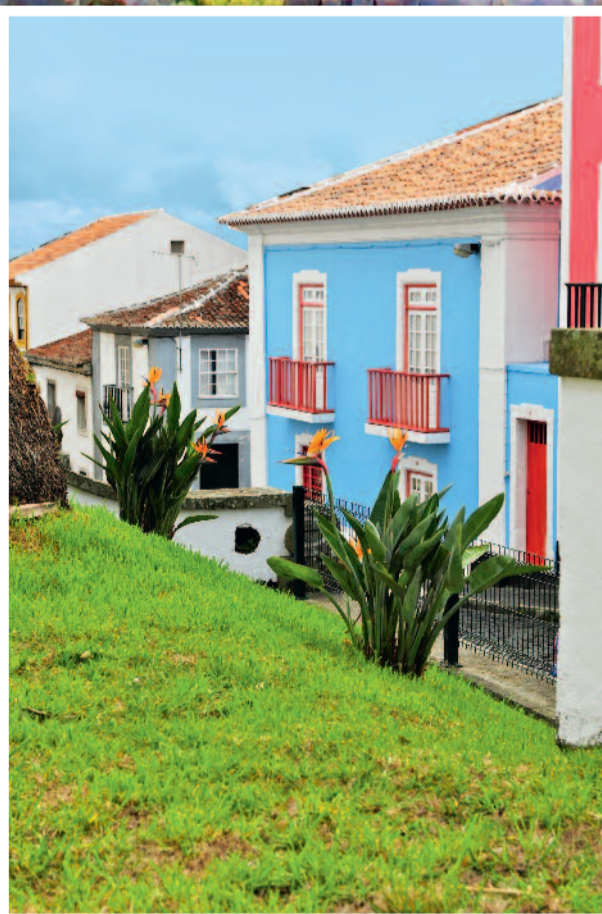
Het stadscentrum van Angra do Heroísmo (Terceira) werd in 1983 tot Werelderfgoed uitgeroepen.

W ie bij de Azoren denkt aan 'eilandhoppen', komt bedrogen uit. De afstand tussen de verst uit elkaar gelegen eilanden, Corvo en Santa Maria, bedraagt zo'n 600 km. Het vliegtuig is de aangewezen manier om tussen de eilanden te reizen, maar wie tijd heeft, kan de boot nemen. Alle negen eilanden ineens bezoeken, is een werk van lange adem. Alle negen eilanden ineens bezoeken, is een werk van lange adem. Bovendien heeft elk eiland zijn eigen karakter, dialect en sfeer. Vandaar dat de meeste toeristen voor één vakantie slechts enkele eilanden uitkiezen. Terceira was het derde eiland van de Azoren dat ontdekt werd vandaar de naam. Wie begint met een bezoek aan Angra do Heroísmo, krijgt meteen het mooiste stadje van de Azoren te zien. Angra is een typisch voorbeeld van een renaissancestadje, met brede, rechte lanen. In die tijd vonden galjoenen beladen met goud,