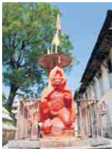
De hindoeïsche god Hanuman.