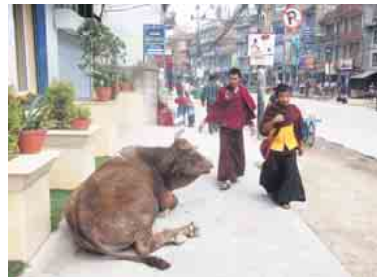
Monniken, op slippers, delen de stoep met een heilige koe.