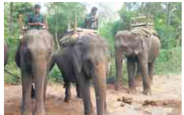
Op olifantensafari in Chitwan National Park.