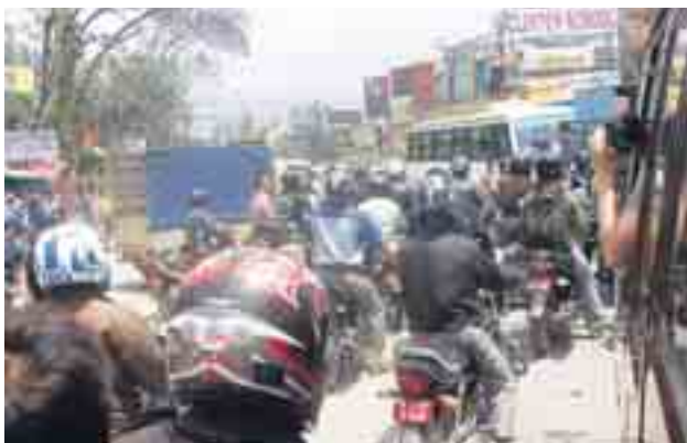
Verkeerschaos in Kathmandu.

Daarna dalen we tot op 150 meter boven zeeniveau, bestemming Chitwan National Park, zo'n 210 kilometer ten oosten van Kathmandu. Over de bedenkelijke 'snelwegen' van Nepal betekent dat al snel een rit van 6 uur. Als kort voor onze aankomst de airc