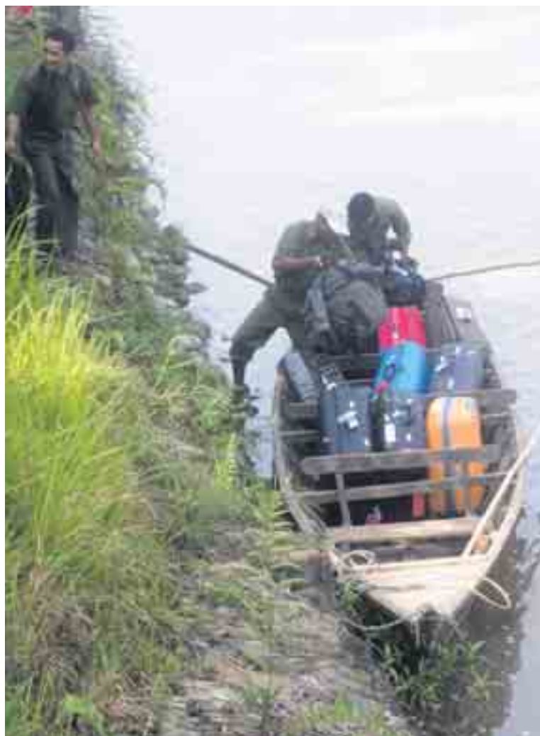
Aan het Island Jungle Resort in Chitwan: koffers en souvenirs eerst.