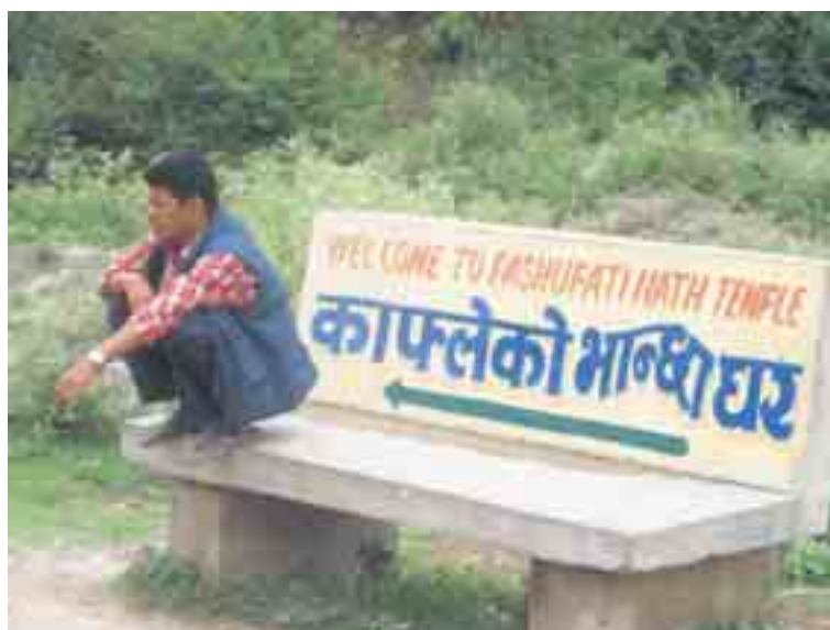
Typische hurkzit, op slippers, en toch op de bank.