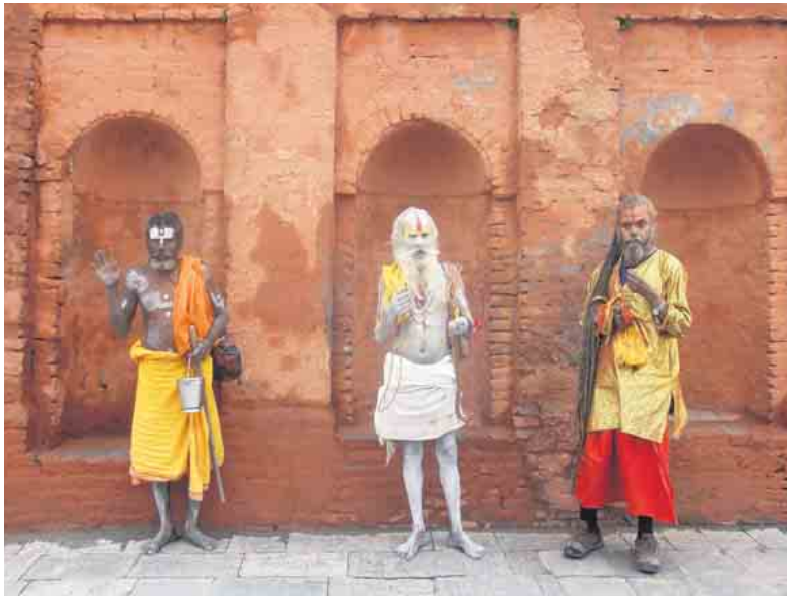
Drie kleurrijke sadhoes, ascetische bedelmonniken, in Pashupatinath.

Op onze laatste Nepaldag is het tijd voor het hoogtepunt van de reis. Letterlijk. Een piekervaring. Letterlijk. Of nog correcter, in het meervoud: piekervaringen. Want met een Jetstream 41, met 30 zitjes, maken we een vlucht langs enkele 7.000- en 8.000-plussers van de Himalaya-bergketen.