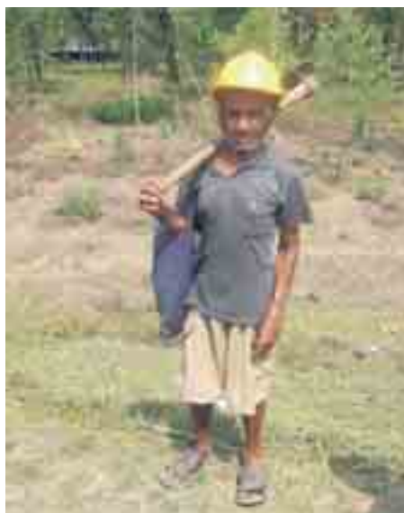
Een trotse wegenwerker, op slippers.