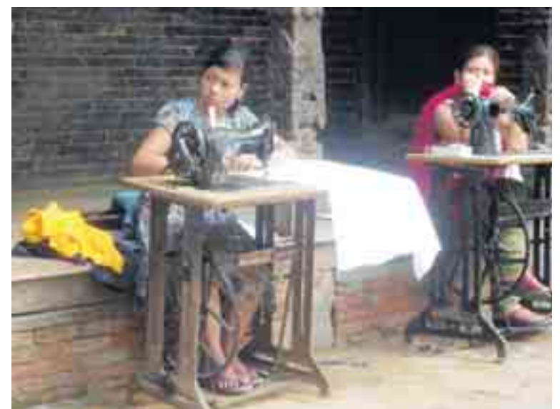
Naaïen op straat, in het middeleeuws ogende Bhaktapur, op slippers.