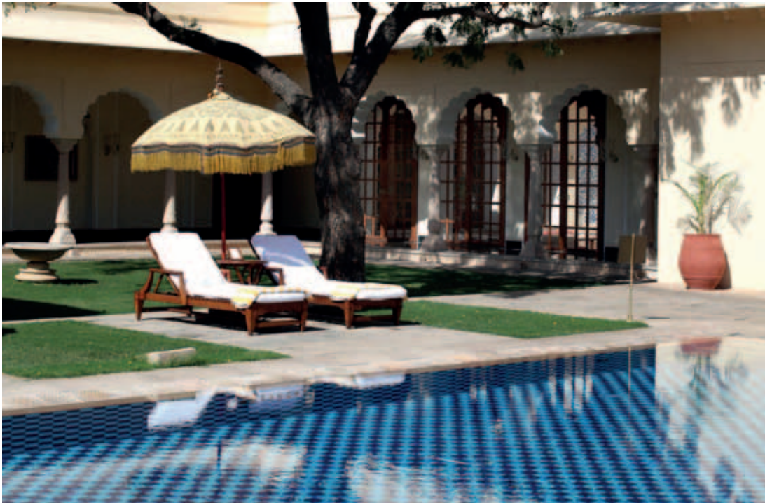
Geen blingbling, maar discrete rust en luxe. Op de foto: het centrale zwembad.

Deze Oberoi won de voorbije 10 jaar meer dan 35 awards. Wereldwijd en in alle mogelijke categorieën.